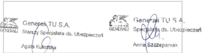
Pieczęć, podpis Ubezpieczyciela